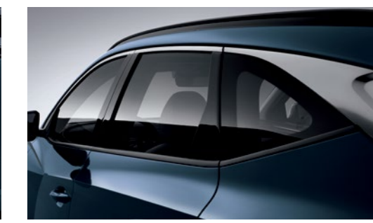
פסי קישוט כרום בחלונות וידיות*