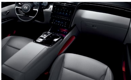
תאורת אווירה ב-64 גוונים