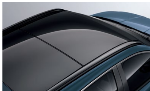
חלון גג פנורמי*