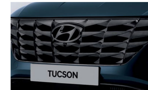
לוגו יונדאי בחזית שבכת הגריל בגימור כרום כהה