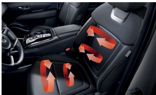
חימום מושבים קדמיים*