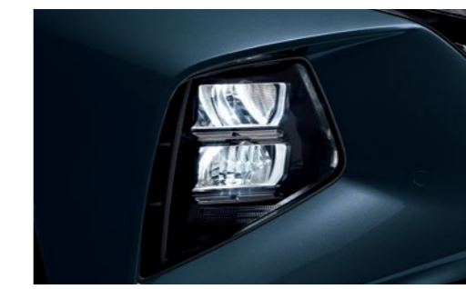
תאורה מלאה מסוג LED*