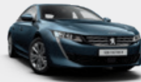
CELEBES BLUE | כחול בהיר מטאלי | SYM0