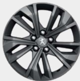
MERIONE MAT 17" חישוק סגסוגת PREMIUM בדגמי