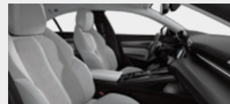
ריפוד פנימי וגימור דלתות בצבע אפור בהיר