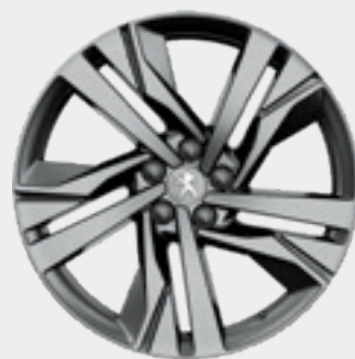
AUGUSTA 19" חישוק סגסוגת GT לדגמי