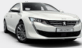
BANQUISE | לבן | WPPO