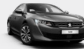
PLATINIUM GREY | אפור כהה מטאלי | VLM0