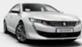
PEARLESCENT WHITE | לבן פנינה מטאלי | N9M6