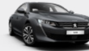
HURRICANE GREY | אפור כהה | 0GP9

בחרו את הצבע שלכם * צבע מטאלי בתוספת תשלום