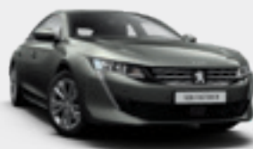
AMAZONITE GREY | אפור ירקרק מטאלי | KLM0