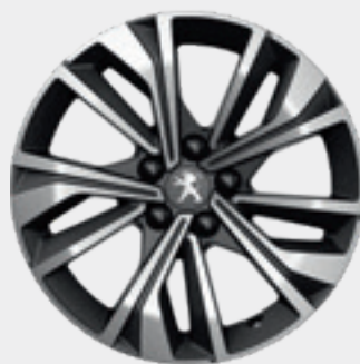
MERIONE DIAMOND 17" חישוק סגסוגת PREMIUM לבחירה בדגמי

בחרו את הצבע שלכם * צבע מטאלי בתוספת תשלום