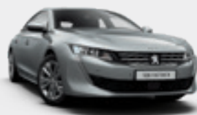
ARTENSE GREY | כסוף כהה מטאלי | F4M0