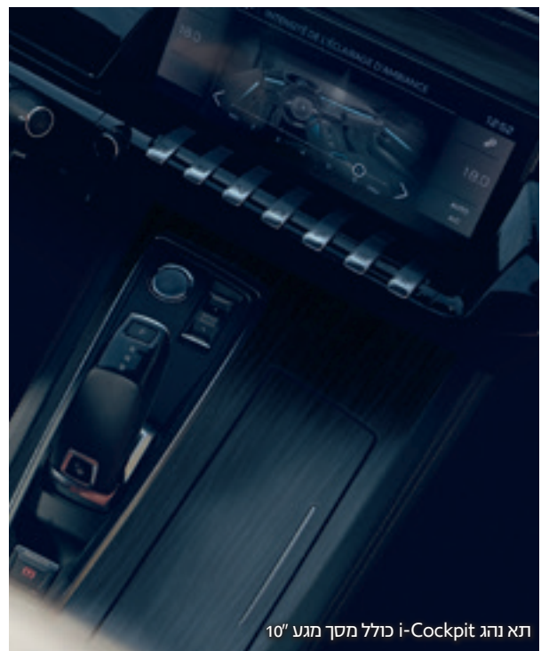
תא נהג i-Cockpit כולל מסך מגע 10"