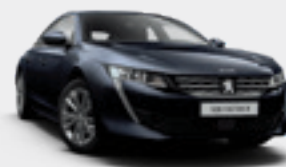
DARK BLUE | כחול כהה מטאלי | KUM0