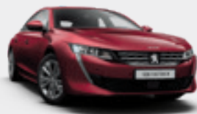
RED ULTIMATE | אדום כהה מטאלי | F3M5