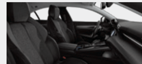
ריפוד פנימי וגימור דלתות בצבע אפור כהה