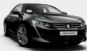
PERLA NERA BLACK | שחור מטאלי | 9VM0