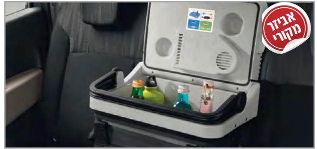
קירורית מק"ט: LP00011541