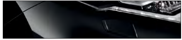
G41 שחור מטאלי