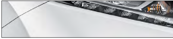
QAB לבן פנינה מטאלי