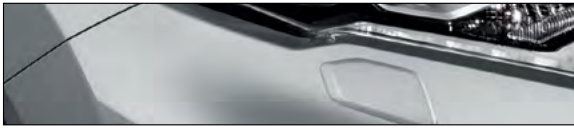
K23 כסף מטאלי