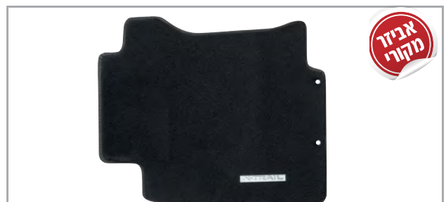
שטיחי לבד מהודרים בגימור שחור מק"ט: LP-00021906