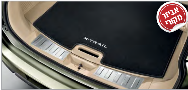
מדרך סף דלת תא מטען מק"ט: LP00021907