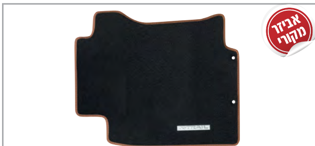
שטיחי לבד מהודרים בגימור חום מק"ט: LP-00021905