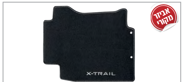
שטיחי לבד מהודרים מק"ט: LP00021904