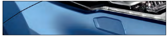
RAW כחול ספיר מטאלי