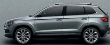
BUSINESS GREY METALLIC (2C)