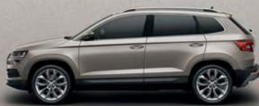
CAPPUCCINO BEIGE METALLIC (4K)