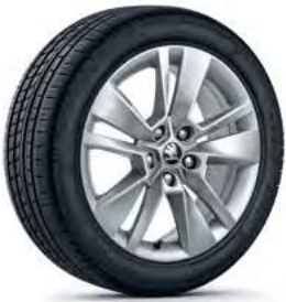
חישוקי סגסוגת 17"