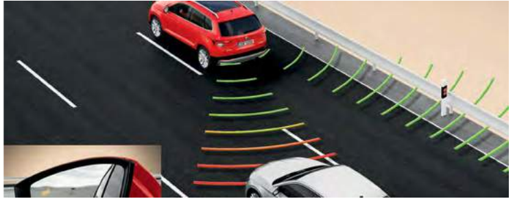
מערכת Blind spot detect