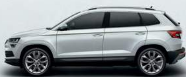
MOON WHITH METALLIC (2Y)