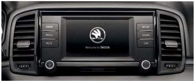
מערכת מולטימדיה מקורית בעלת מסך בגודל 6.5"