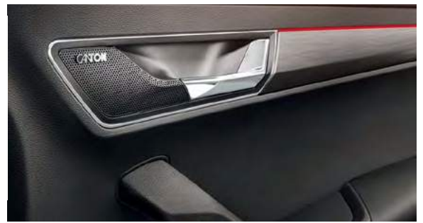
מערכת שמע Canton הכוללת 10 רמקולים