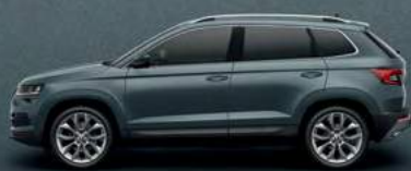
QUARTZ GREY METALLIC (F6)