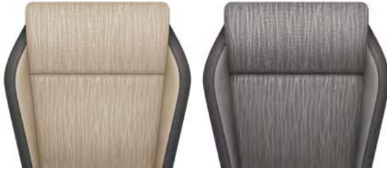
ריפודי בד - שחור / ב'ל