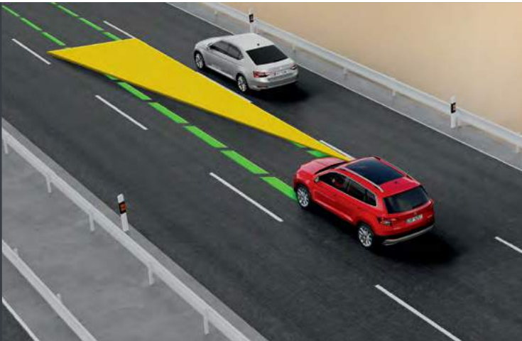
מערכת אקטיבית Lane assist