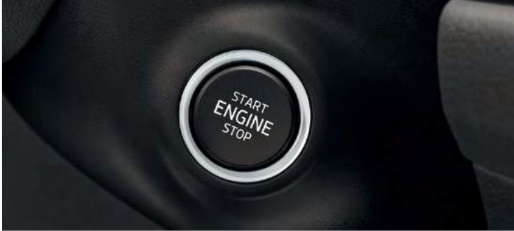
מערכת Kessy - כניסה והנעה ללא מפתח