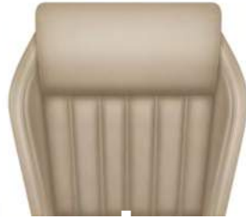
ריפוד מושבים מעור / אלקנטרה