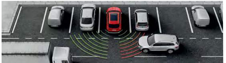
מערכת אקטיבית Rear traffic alert