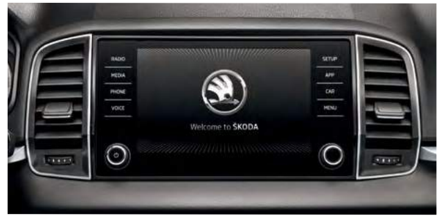
מערכת מולטימדיה מקורית בעלת מסך בגודל 8"