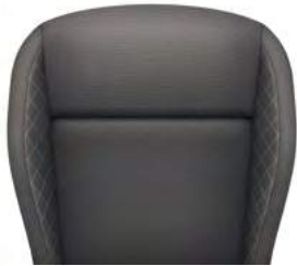
ריפודי בד - שחור