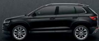
MAGIC BLACK METALLIC (1Z)