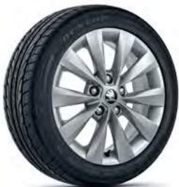
חישוקי סגסוגת 16"