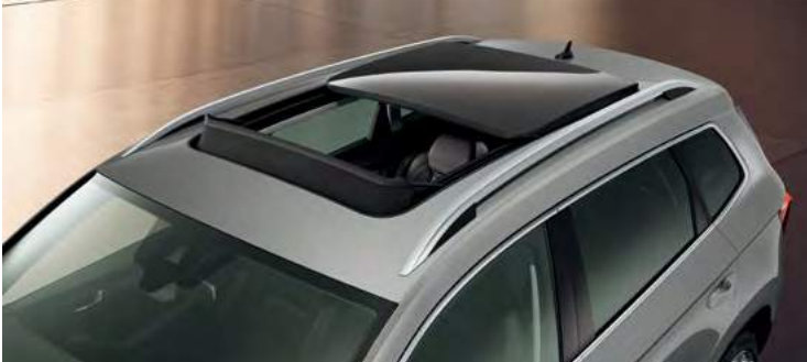
גג שמש פנורמי עם פתיחה חשמלית