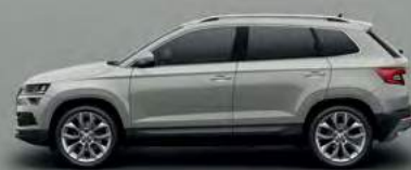
STEEL GREY UNI (M3)