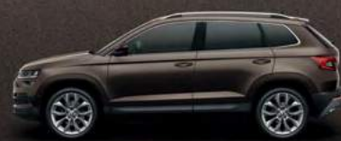
MAGNETIC BROWN METALLIC (0J)