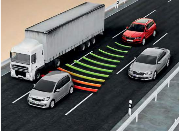
בקרת שיוט אדפטיבית - Adaptive cruise control