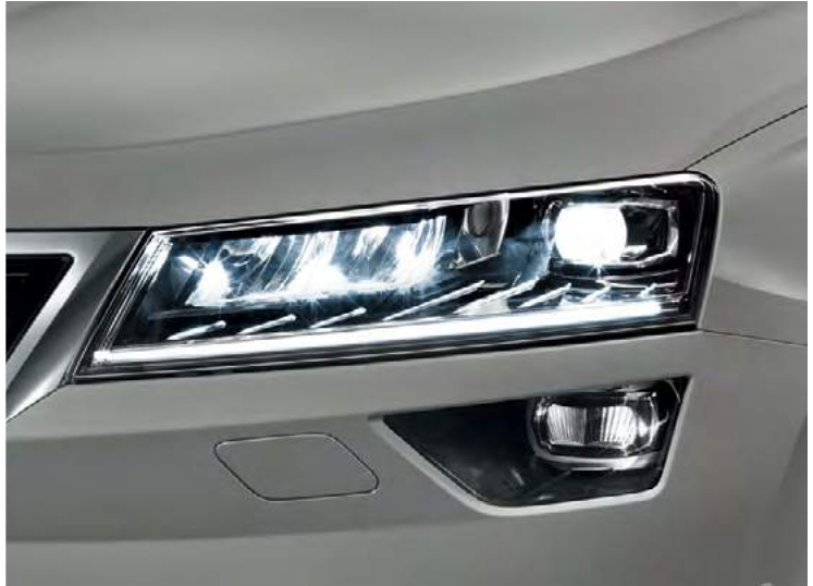
פנסים קדמיים Full LED