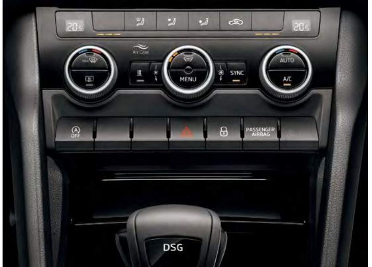
מערכת בקרת אקלים דיגיטלית - Climatronic בעלת 2 אזורים