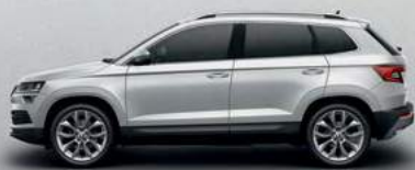
BRILIANT SILVER METALLIC (6E)