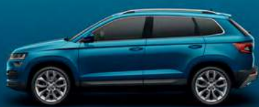
LAVA BLUE METALLIC (0F)