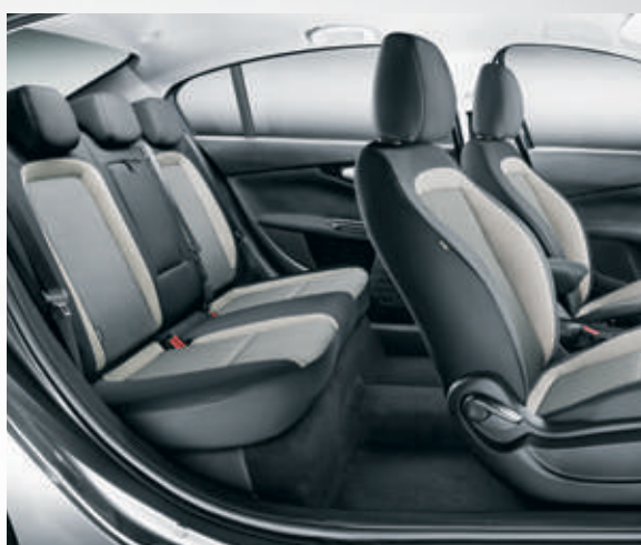
בד שחור בז' 156