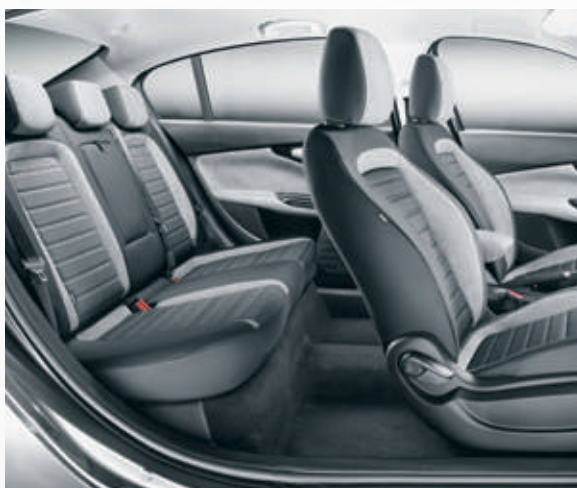
בד יקרתי אפור 111