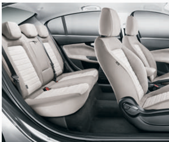
בד יקרתי בז' 165