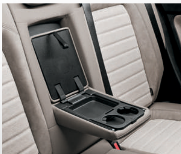
משענת יד אחורית + תא אחסון ומתקני כוסות (בדגם LOUNGE)