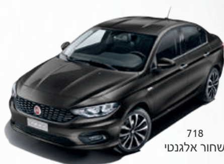
718 שחור אלגנטי