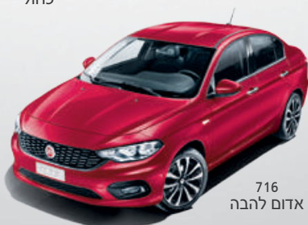
716 אדום להבה