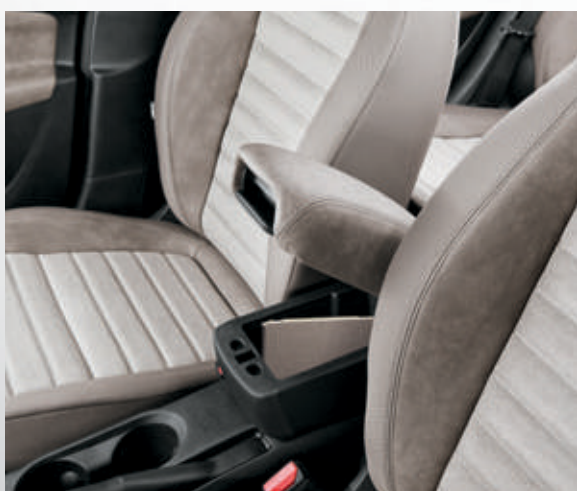
משענת יד קדמית + תא אחסון