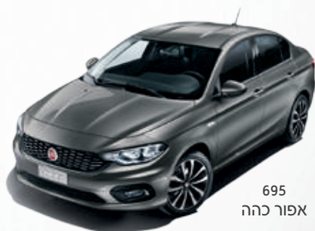
695 אפור כהה