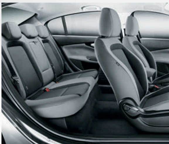
בד שחור כסוף 152