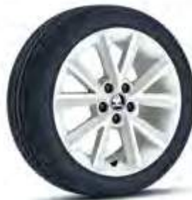
לבן (בשילוב עם גג לבן)