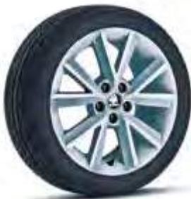
כסף (בשילוב עם גג כסף)