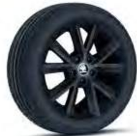
שחור (בשילוב עם גג שחור)