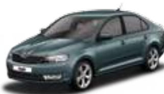
Metal Grey metallic - F6