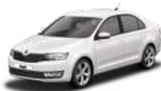
Candy White uni - 9P