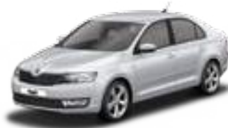
Brilliant Silver metallic - 8E