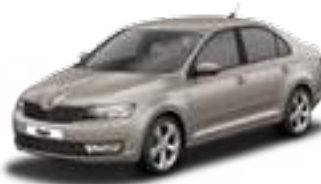
Cappuccino Beige metallic - 4K