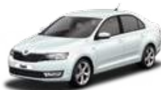
Moon White metallic - 2Y