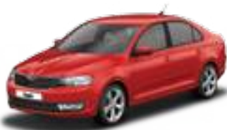
Corrida Red uni - 8T