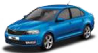
Race Blue metallic - X8