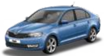
Denim Blue metallic - G0