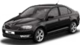
Black Magic pearl effect - 1Z