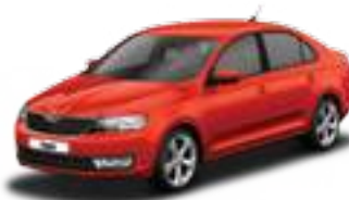
Rio Red metallic - 6X

יתכנו הבדלים בין התיאור, המידע, הנתונים והתמונות המובאים בפרוספקט/קטלוג זה לבין הדגמים המשווקים על ידי החברה, הן מבחינת המפרט הטכני והן מבחינת האביזרים והמערכות הנלוות. כמו כן, יתכנו הבדלים בדגם מסוים ו/או במוצרי התעבורה ו/או באביזרים בהתאם לשינויים הנעשים ע"י היצרן מעת לעת. אין בפרסום המובא בפרוספקט/קטלוג כדי לחייב את היצרן ו/או את החברה בהספקת דגם/ים שיקללו את כל או חלק מהאביזרים, הציוד והמערכות המתוארים בו. היצרן ו/או החברה שומרים לעצמם את הזכות לבטל, להוסיף, לשנות ולשפר, ללא הודעה מוקדמת וללא עדכון הפרוספקט/קטלוג. התמונות להמחשה בלבד וכוללות תוספות שאינן חלק מהמפרט. החברה רשאית לשנות את המפרט בכל עת. המפרט המחייב הינו כפי שמופיע ע"ג ההזמנה באולם התצוגה. ט.ל.ח.