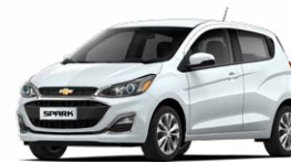
לבן פסגה (GAZ)