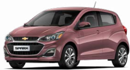
ורוד אפרפר מטאלי (GHN)