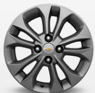
חישוקי אלומיניום 15" (Premier, LTZ)