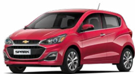
אדום פטל מטאלי (GSU)