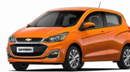
כתום הדר מטאלי (GL5)