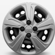
כיסויי גלגלים 15" (LT+)