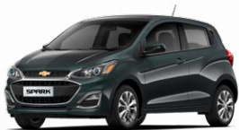
אפור כהה מטאלי (GK2)