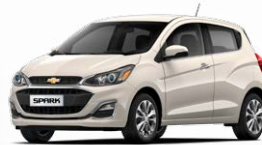
חום סהרה מטאלי (GV8)