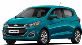
כחול קריבי מטאלי (GZO)