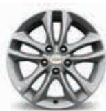
חישוקי אלומיניום 17"